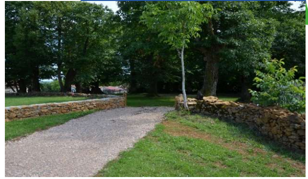
Entrée de la châtaigneraie

Dès cet été, 2 soirées guinguette y seront organisées par le Comité des Fêtes (19 juillet et 16 août) . Ce sera pour nous l'occasion de tester si l'aire est suffisamment bien aménagée. Quelques photos de l'aire :