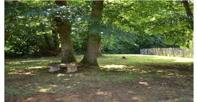
Banc en pierre