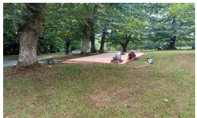
Piste de danse et terrain de pétanque